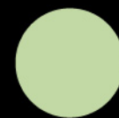
綠茶 Green Tea

99 / 3 件 · pc 188 / 6 件 · pc 368 / 12 件 · pc 558 / 20 件 · pc