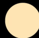
海鹽牛油焦糖 Salted Butter Caramel