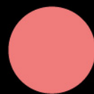
玫瑰花瓣 Rose Petal