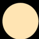
熱情果 Passion Fruit